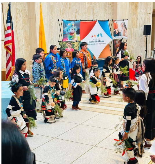
En la foto: Bailarines de la escuela comunitaria Te Tsu Geh Oweengeh y del programa para la primera infancia del pueblo de Tesuque actúan en el evento del Día de la Primera Infancia, que se celebra cada año en el Roundhouse.