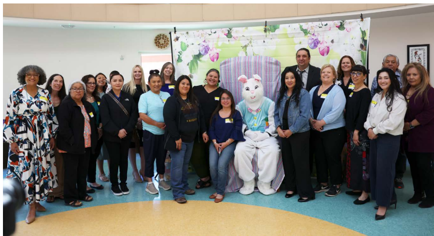
En la foto: Los miembros del NMECTAC y del Departamento de la Primera Infancia de Colorado se reunieron en el pueblo de Isleta el 18 de abril de 2024 para conversar sobre las vías de acceso al mercado laboral y las estrategias de inversión tribal. La visita incluyó un recorrido por el centro de cuidado infantil y Head Start de Isleta, con la aparición sorpresa del conejo de pascua.

universidades tribales para crear vías asequibles y con base cultural que apoyen la obtención de títulos universitarios para los educadores de la primera infancia, al tiempo que centren la lengua y la cultura indígenas en el plan de estudios. A través de estas colaboraciones, se les concedieron 243 becas a estudiantes indígenas, se otorgaron 22 incentivos de certificación bilingüe a educadores indígenas de la primera infancia y 170 participantes en programas multilingües recibieron becas de $1500.