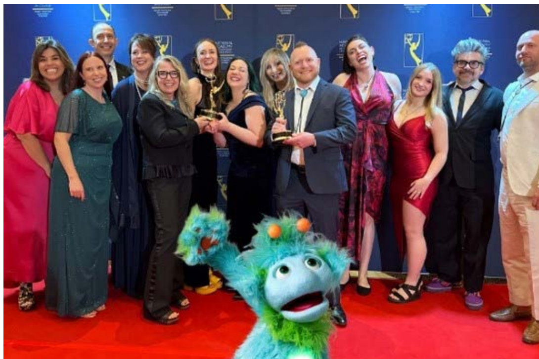
En la foto: El equipo de The Early Show with Alax celebra haber ganado un premio Emmy regional de las Montañas Rocosas por su excelente programación educativa e informativa, junto con Alax, el embajador intergaláctico de la atención en Nuevo México.