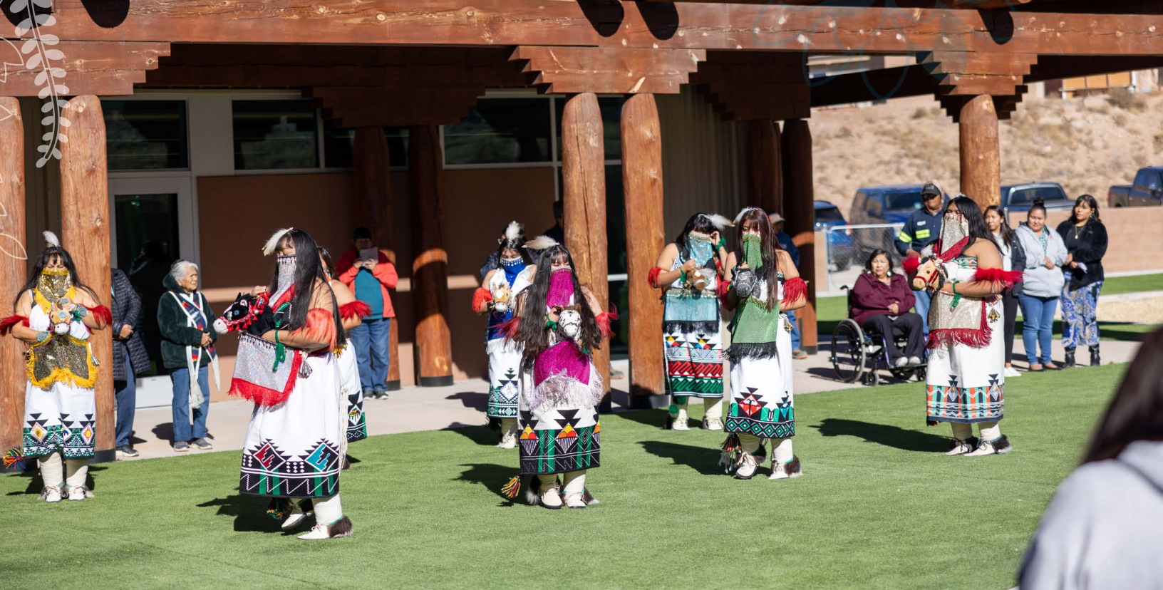
Bailarines tradicionales actuaron en la gran inauguración del Centro de Enriquecimiento y Aprendizaje en pueblo de Zia el 19 de diciembre de 2024. La celebración reunió a líderes tribales y estatales.